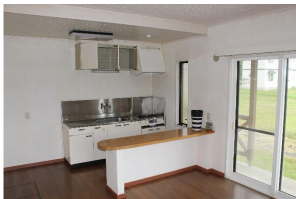
<キッチン・ダイニング>